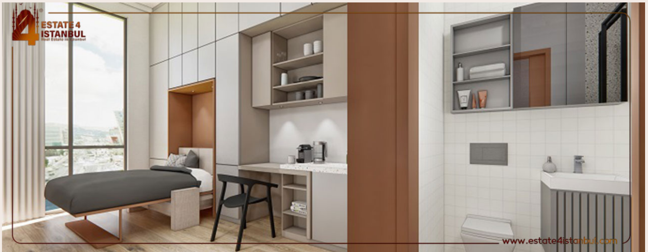
Yakuplu mah. Hürriyet blv. Skyport residence. No:1/C3 Beylikdüzü İstanbul TR