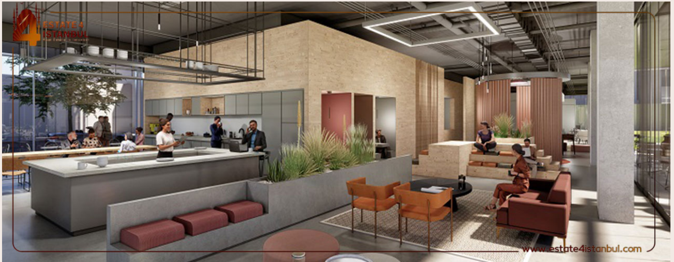
Yakuplu mah. Hürriyet blv. Skyport residence. No:1/C3 Beylikdüzü İstanbul TR