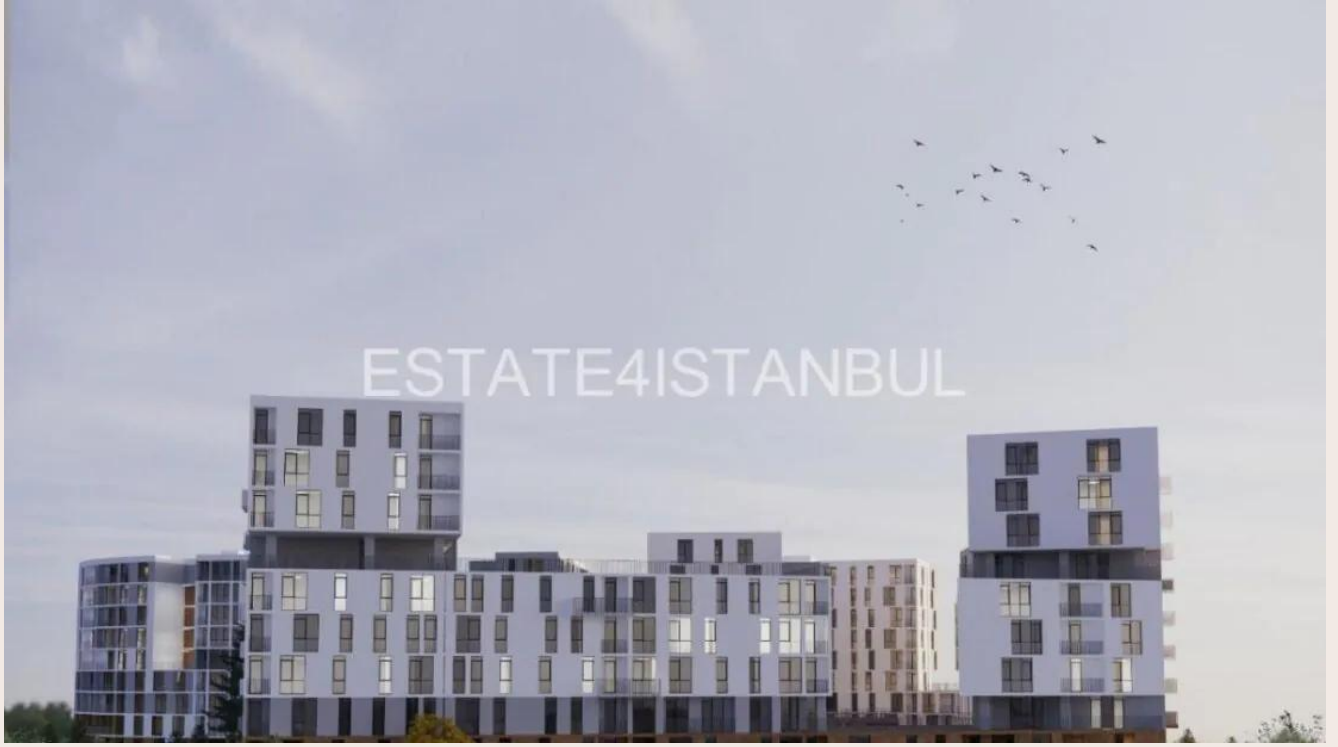
Yakuplu mah. Hürriyet blv. Skyport residence. No:1/C3 Beylikdüzü İstanbul TR