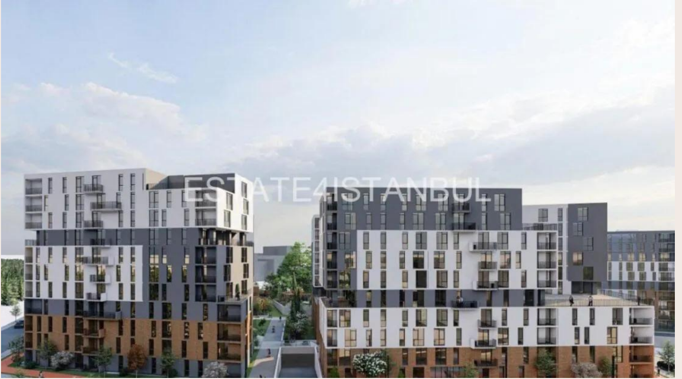
Yakuplu mah. Hürriyet blv. Skyport residence. No:1/C3 Beylikdüzü İstanbul TR