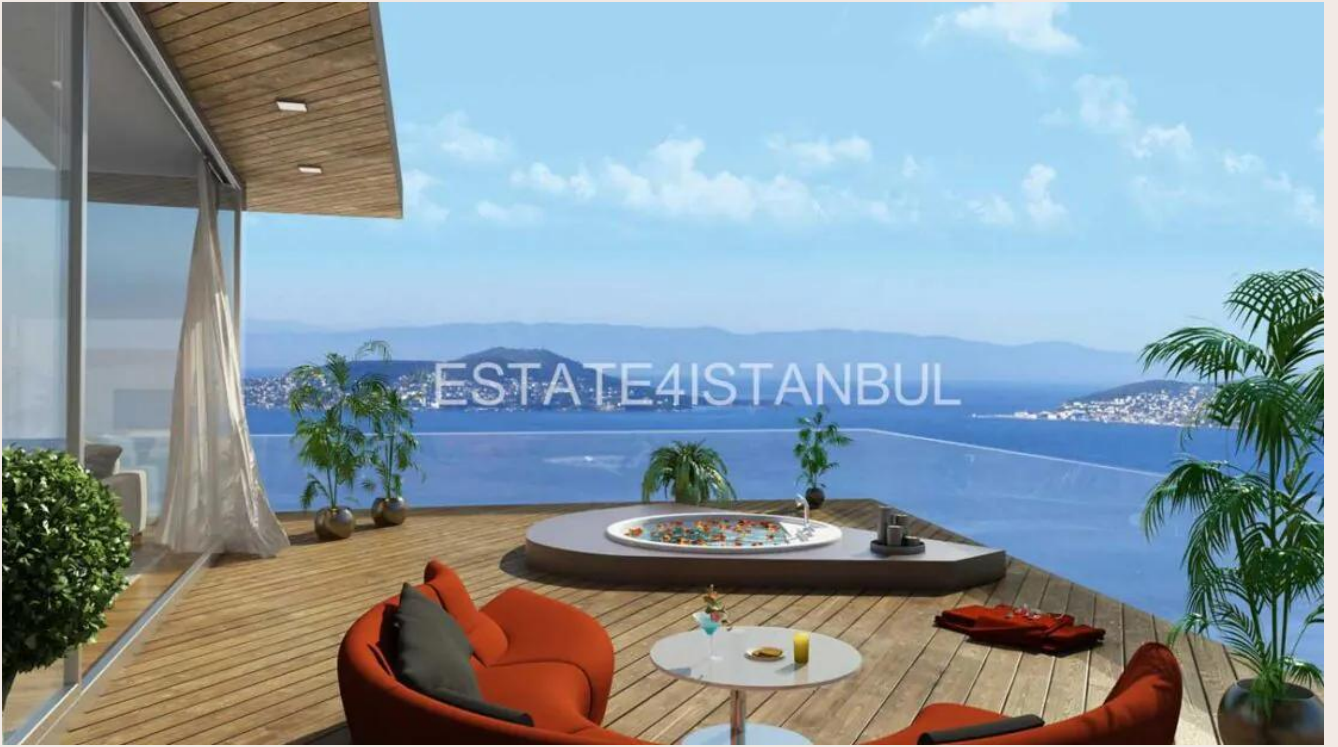
Yakuplu mah. Hürriyet blv. Skyport residence. No:1/C3 Beylikdüzü İstanbul TR