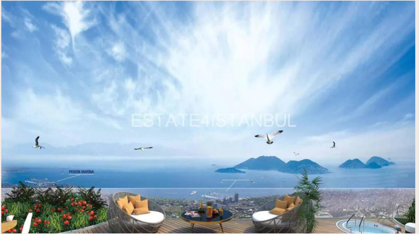
Yakuplu mah. Hürriyet blv. Skyport residence. No:1/C3 Beylikdüzü İstanbul TR