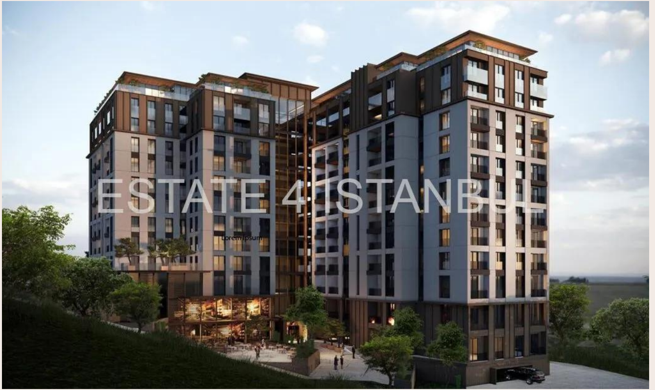
Yakuplu mah. Hürriyet blv. Skyport residence. No:1/C3 Beylikdüzü İstanbul TR