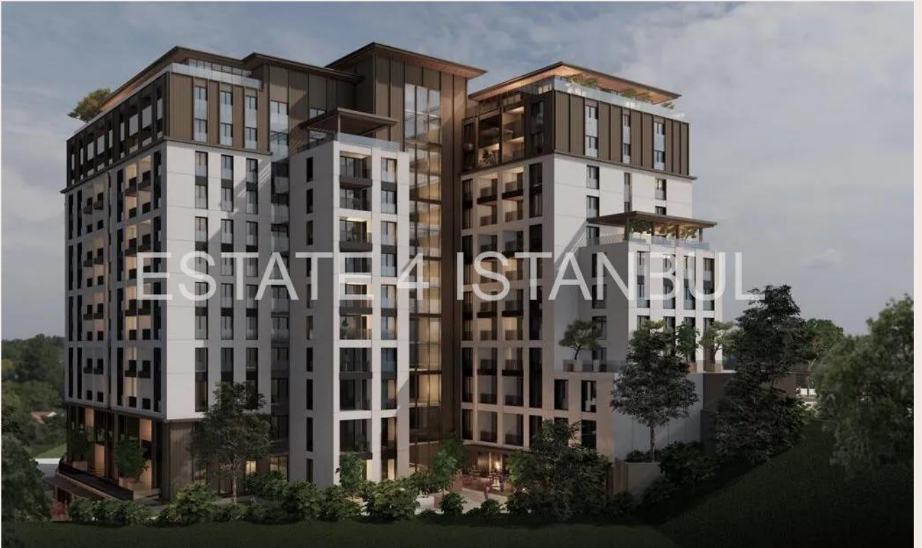
Yakuplu mah. Hürriyet blv. Skyport residence. No:1/C3 Beylikdüzü İstanbul TR