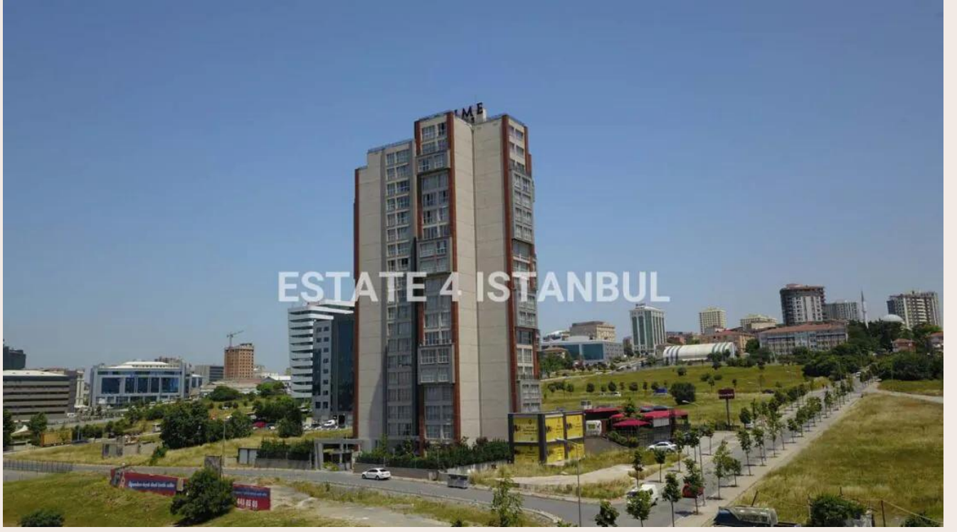
Yakuplu mah. Hürriyet blv. Skyport residence. No:1/C3 Beylikdüzü İstanbul TR