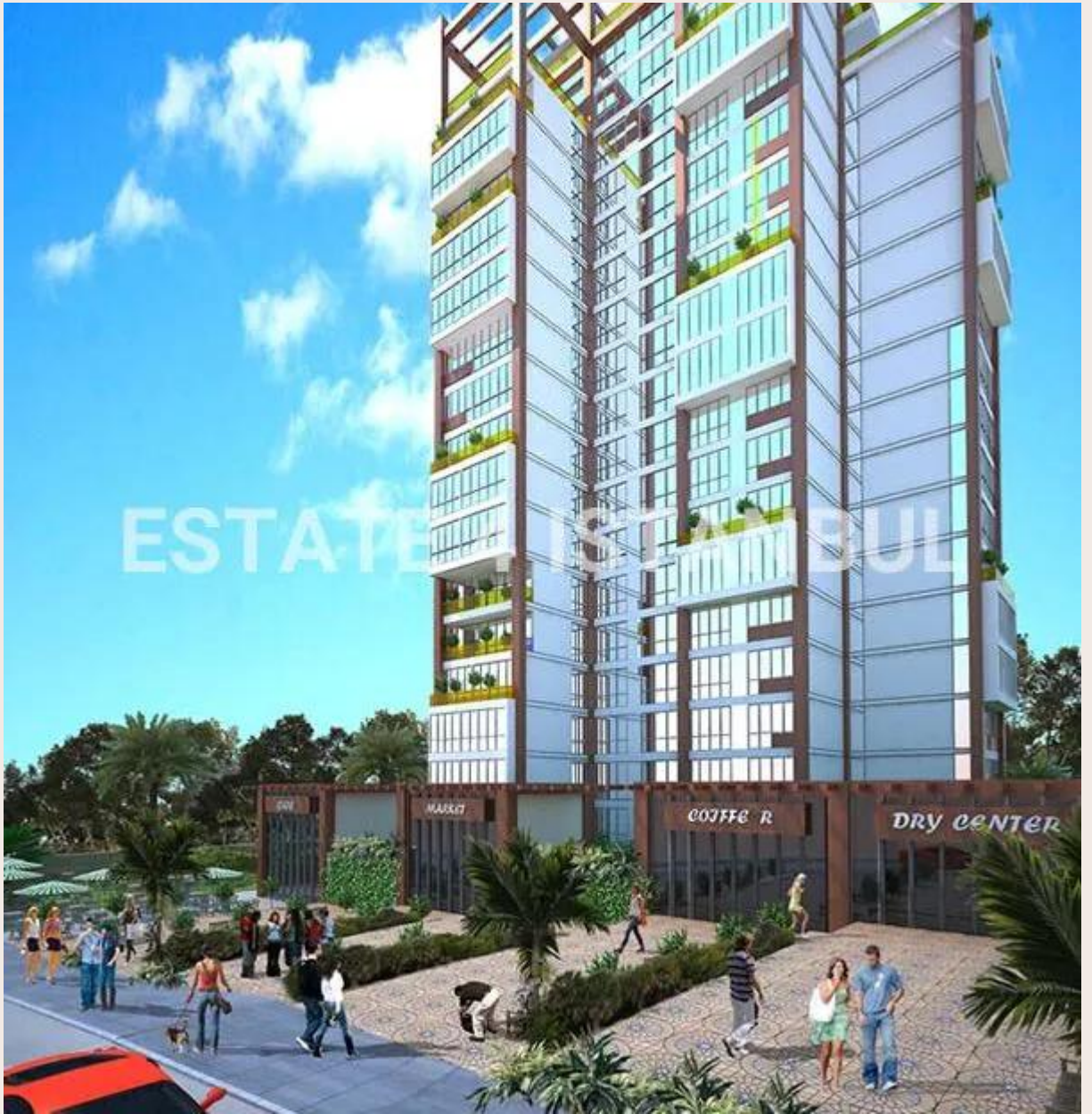
Yakuplu mah. Hürriyet blv. Skyport residence. No:1/C3 Beylikdüzü İstanbul TR