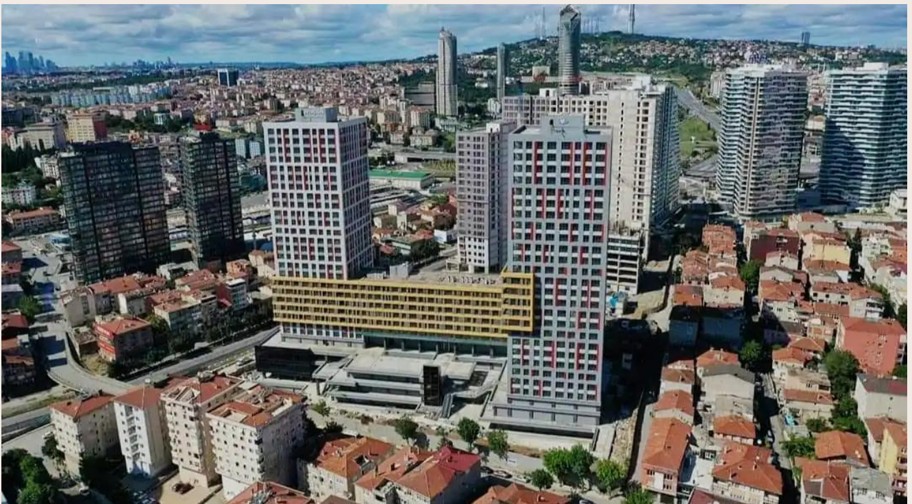
Yakuplu mah. Hürriyet blv. Skyport residence. No:1/C3 Beylikdüzü İstanbul TR