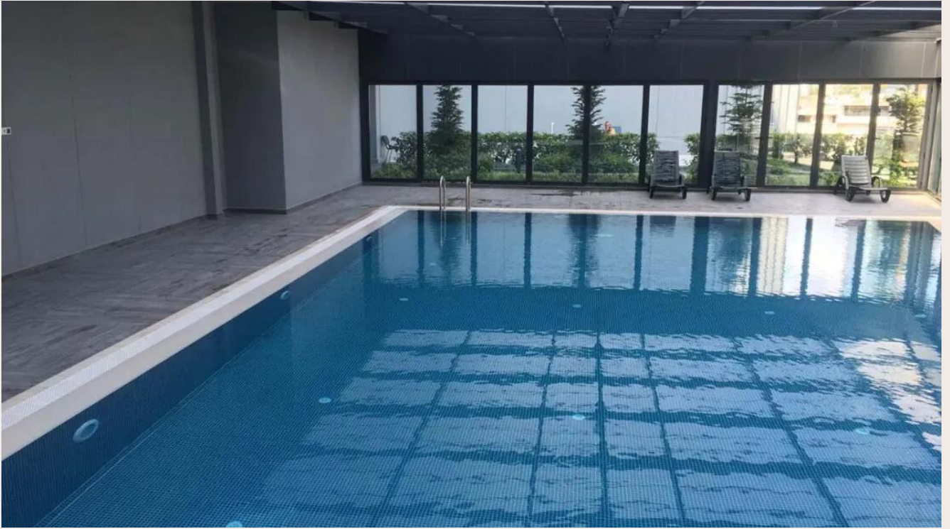
Yakuplu mah. Hürriyet blv. Skyport residence. No:1/C3 Beylikdüzü İstanbul TR