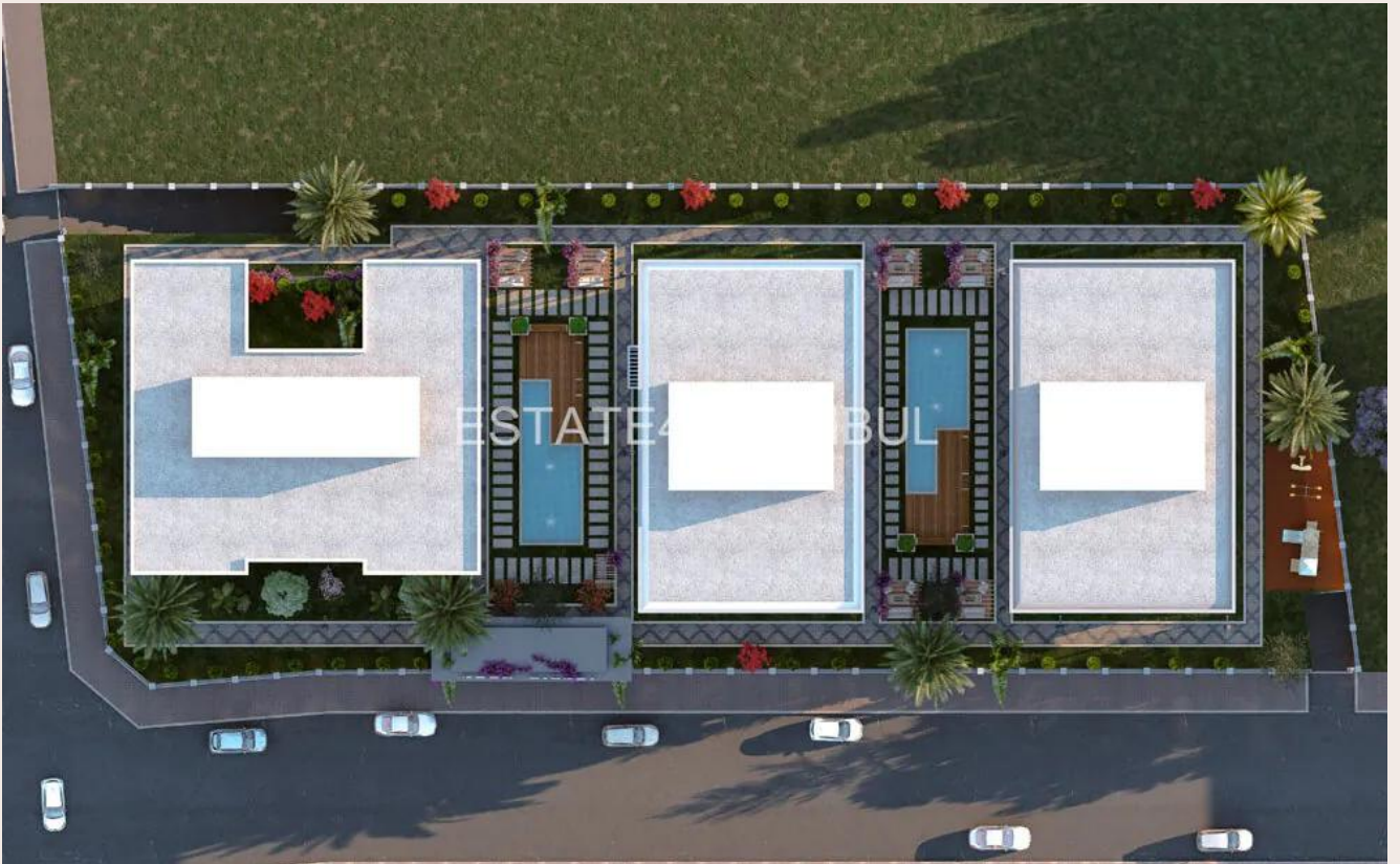
Yakuplu mah. Hürriyet blv. Skyport residence. No:1/C3 Beylikdüzü İstanbul TR