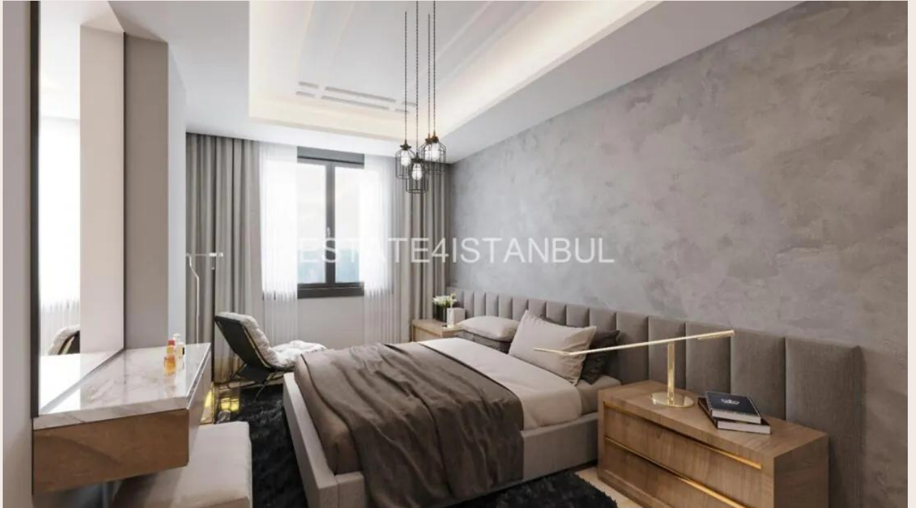
Yakuplu mah. Hürriyet blv. Skyport residence. No:1/C3 Beylikdüzü İstanbul TR