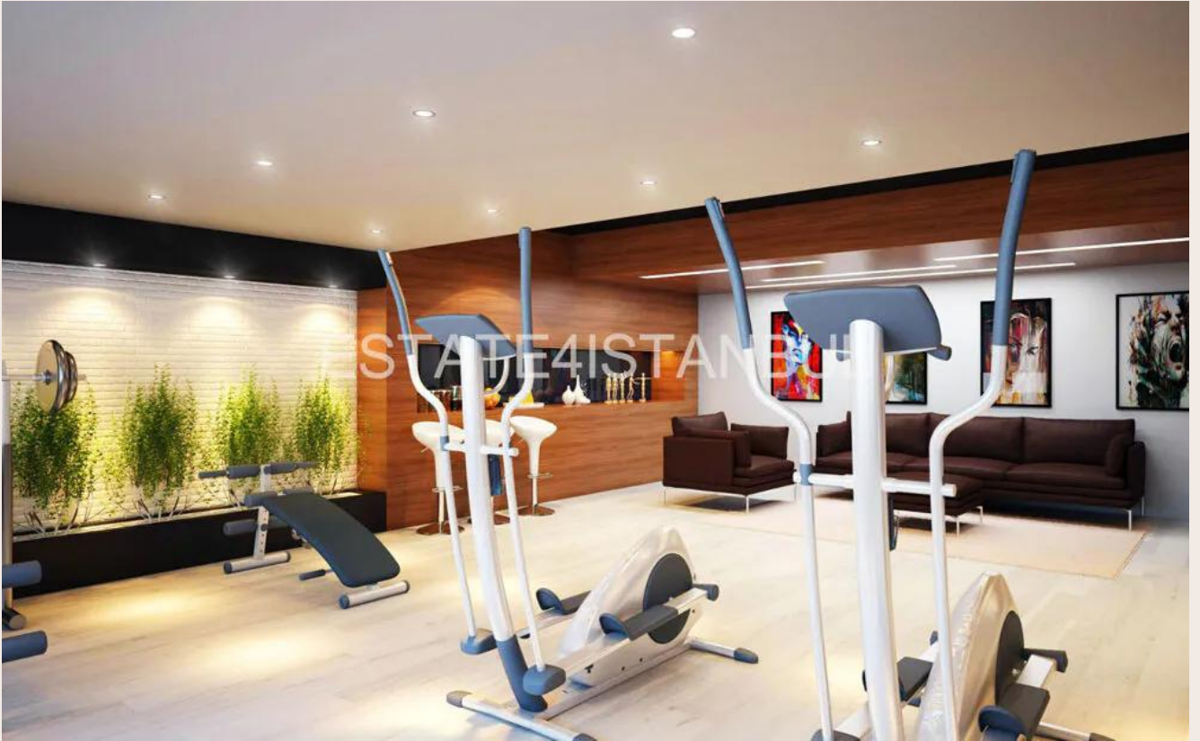
Yakuplu mah. Hürriyet blv. Skyport residence. No:1/C3 Beylikdüzü İstanbul TR