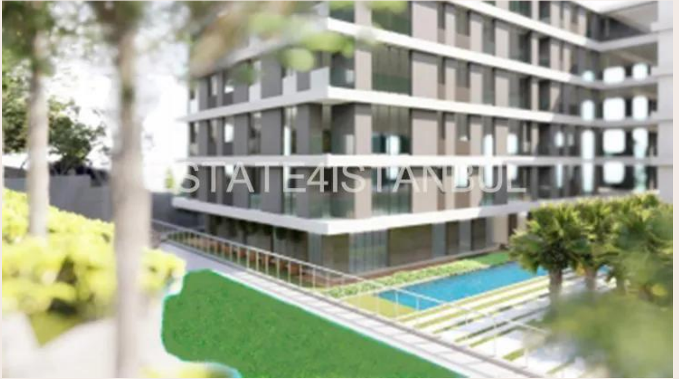
Yakuplu mah. Hürriyet blv. Skyport residence. No:1/C3 Beylikdüzü İstanbul TR