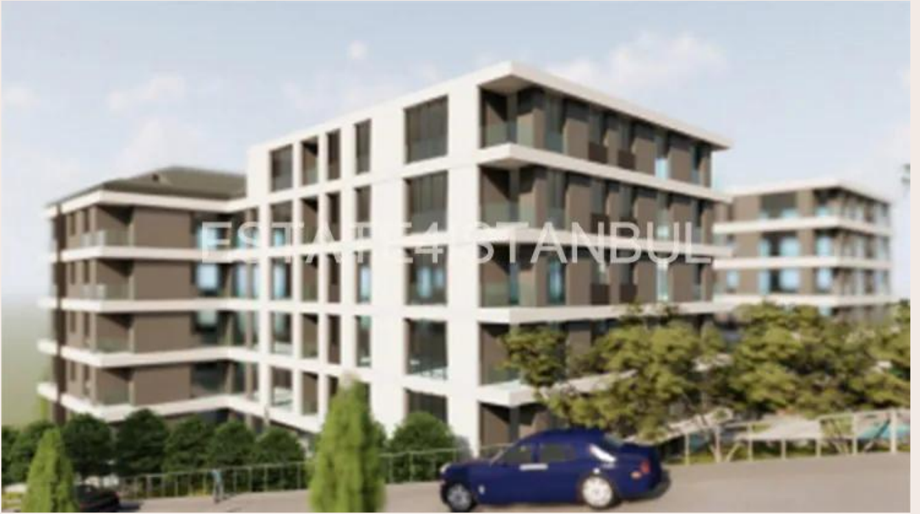
Yakuplu mah. Hürriyet blv. Skyport residence. No:1/C3 Beylikdüzü İstanbul TR