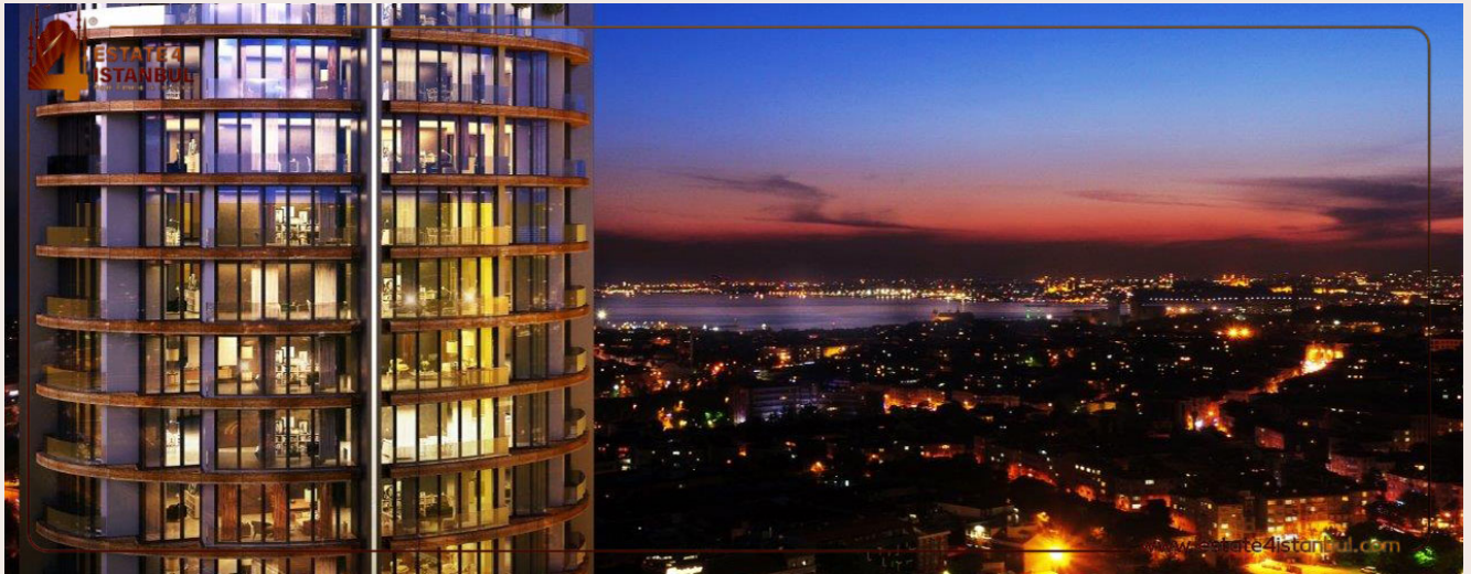
Yakuplu mah. Hürriyet blv. Skyport residence. No:1/C3 Beylikdüzü İstanbul TR