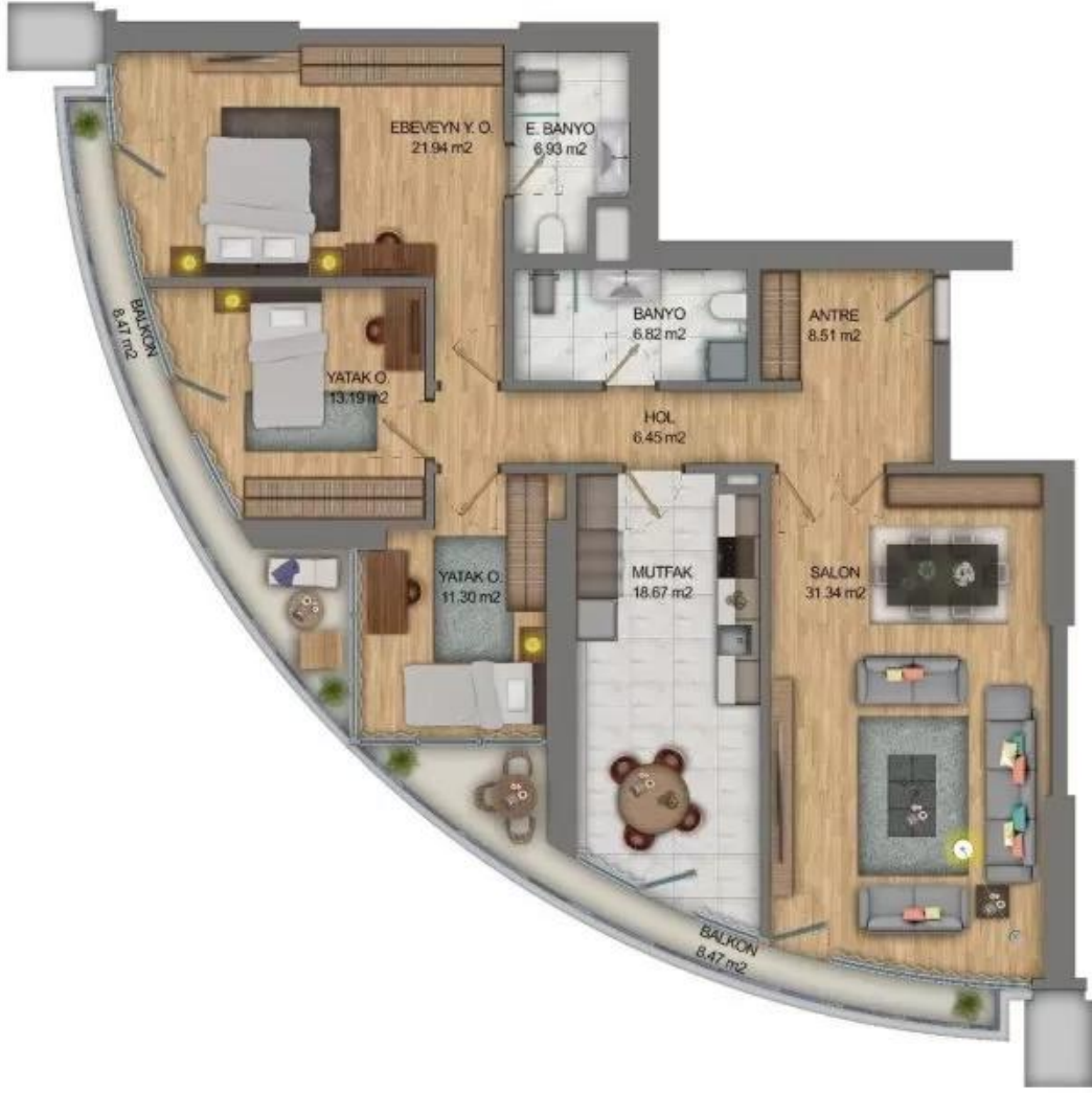
Yakuplu mah. Hürriyet blv. Skyport residence. No:1/C3 Beylikdüzü İstanbul TR