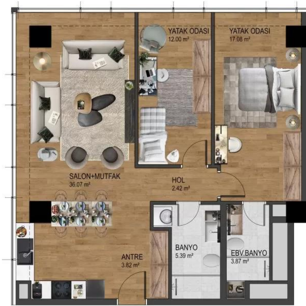
▲ DAİRE NO - 83