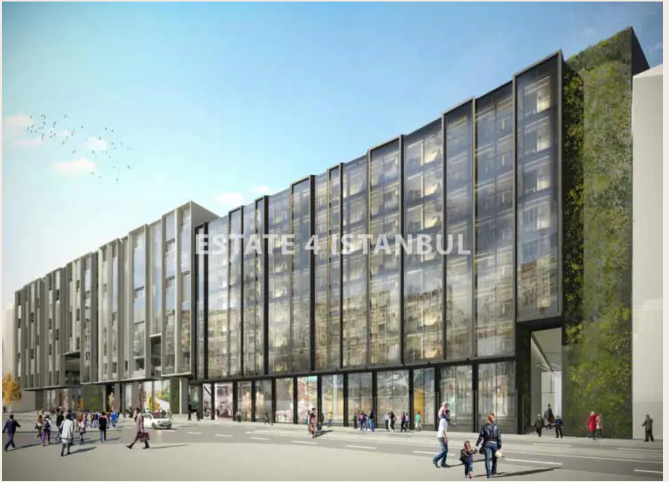
Yakuplu mah. Hürriyet blv. Skyport residence. No:1/C3 Beylikdüzü İstanbul TR